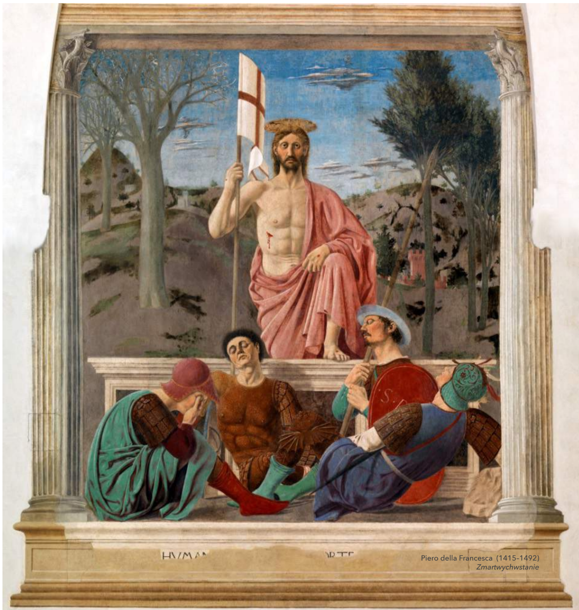
Piero della Francesca (1415-1492) Zmartwychwstanie

Kochani Polacy i Polki, Bracia i Siostry, którzy modlicie się z nami w Zurychu, Winterthurze i Kleinandelfingen.