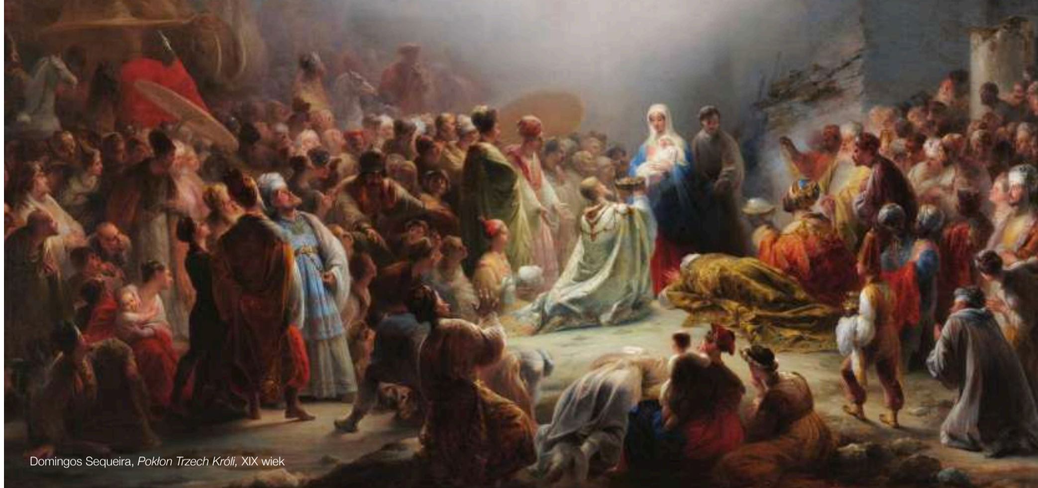
Domingos Sequeira, Pokłon Trzech Króli , XIX wiek

Na pamiątkę oddania czci małemu Jezusowi przez Mędrców ze Wschodu oznaczamy drzwi naszych mieszkań literami C+M+B i podajemy aktualny rok. Gest ten stanowi jednocześnie prośbę o Boże błogosławieństwo dla wszystkich mieszkańców i odwiedzających.