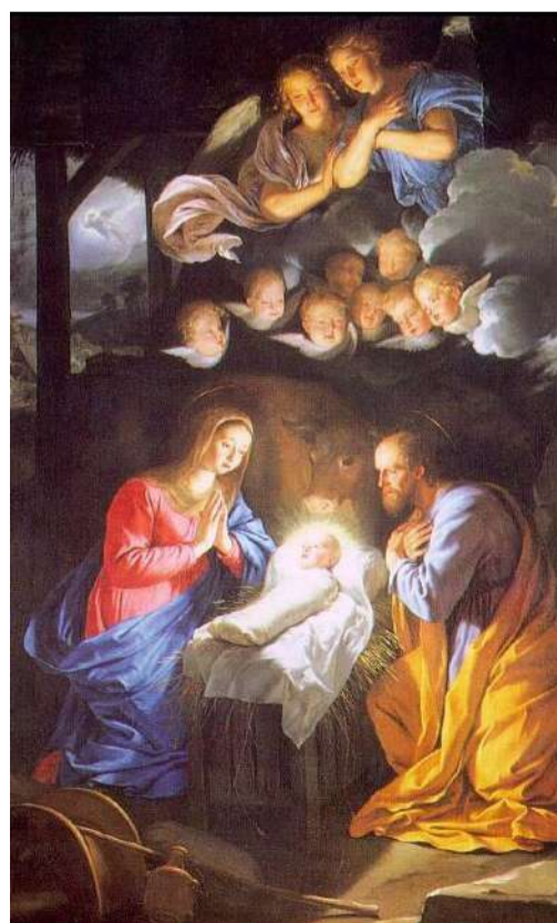
Philippe de Champaigne, Narodzenie Jezusa, ok.1650