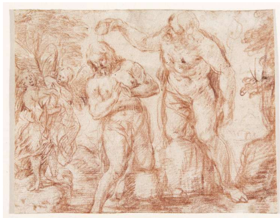
Juan Carreño de Miranda, Chrzest Chrystusa , ok. 1680

Podczas Mszy świętej 33 dzieci, które przygotowują się do przyjęcia pierwszej komunii świętej odnowią swoje przyrzeczenia z chrztu. Towarzyszyć im będą rodzice, którzy również biorą czynny udział w całym przygotowaniu do tego wydarzenia. Jest to dla naszej wspólnoty moment bardzo ważny i wzruszający, zwłaszcza dla rodziców.