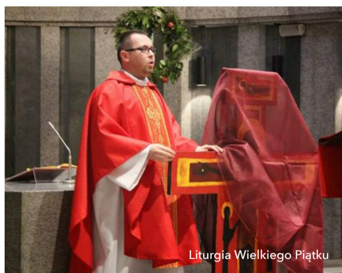
Liturgia Wielkiego Piątku