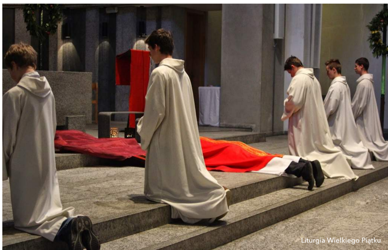
Liturgia Wielkiego Piątku