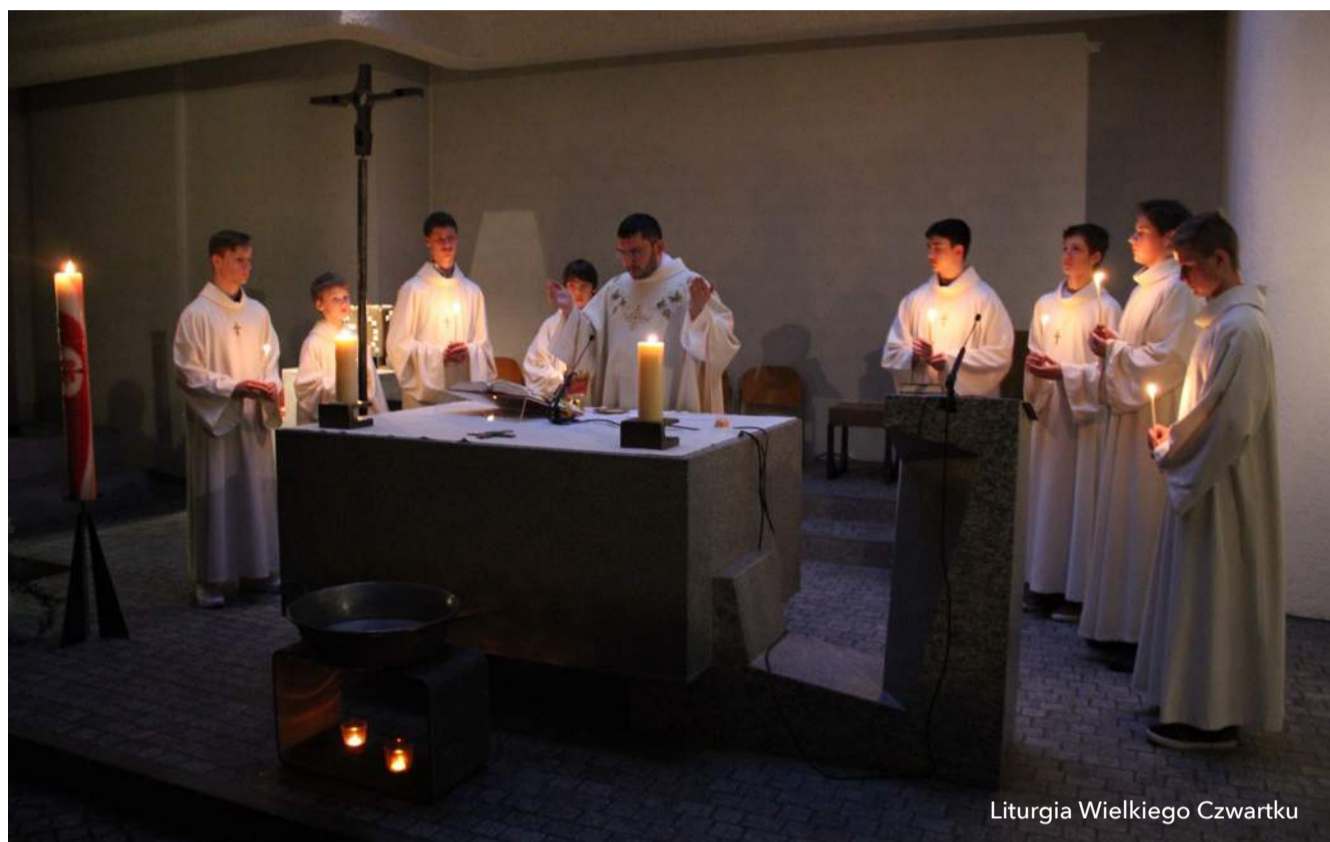
Liturgia Wielkiego Czwartku