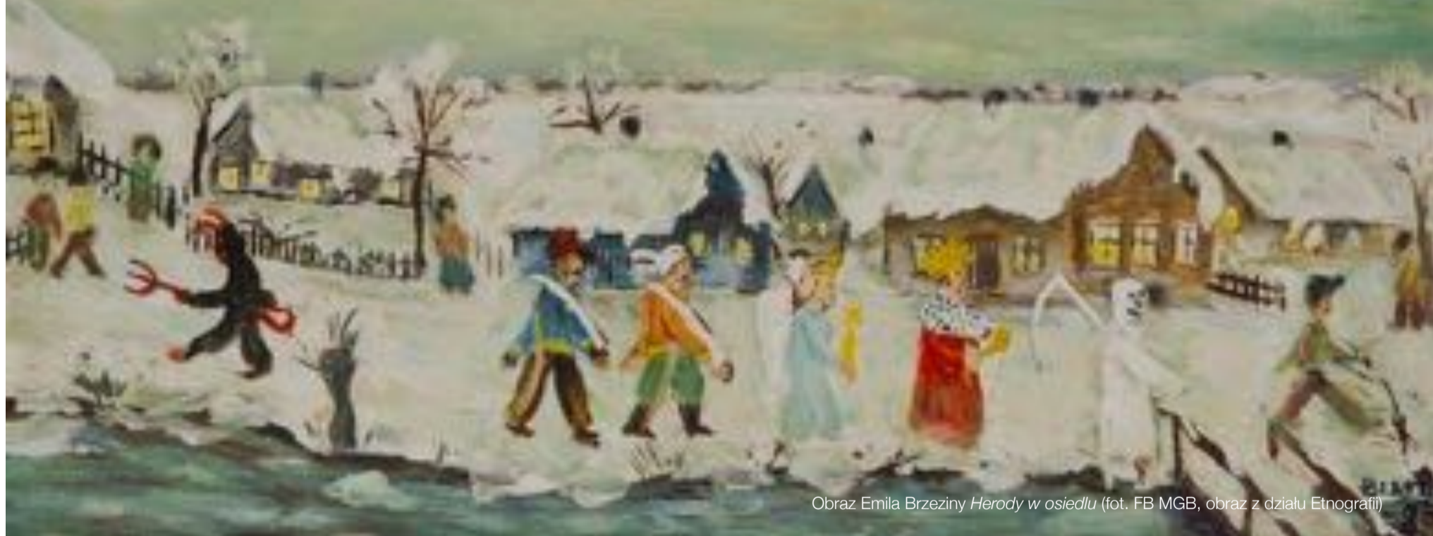
Obraz Emila Brzeziny Herody w osiedlu (fot. FB MGB, obraz z działu Etnografii)

Czy wiesz, że słowo kolęda, oznaczające dziś pieśń związaną z tematyką Bożego Narodzenia, pochodzi z łaciny? Kalendy w kalendarzu rzymskim oznaczały pierwszy dzień każdego miesiąca.