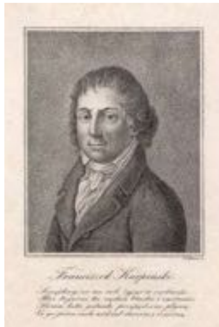
Franciszek Karpiński

Drodzy Rodacy! Szanujmy polonezy! Mamy ich wśród kolęd więcej, jak choćby: Dzisiaj w Betlejem, W żłobie leży (piękny, siedemnastowieczny), Z narodzenia Pana dzień dziś wesoły . Grajmy je i śpiewajmy jak na Polaków przystało. Z życiem!